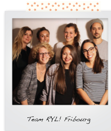
Team RYL! Fribourg

ROCK YOUR LIFE! ist ein Mentoring-Programm zwischen Studierenden resp. jungen Arbeitnehmenden und Jugendlichen des 8. und 9. Schuljahres. Ziel des Eins-zu-Eins-Mentorings ist die Unterstützung der Jugendlichen für einen erfolgreichen Übergang in die Ausbildung. Teil des ROCK YOUR LIFE! Netzwerks sind ausserdem Partnerunternehmen. Diese ermöglichen den SchülerInnen früh und vertieft einen Einblick in die Berufswelt.