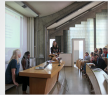
Mutige Hornella beim Vorlesungsbesuch