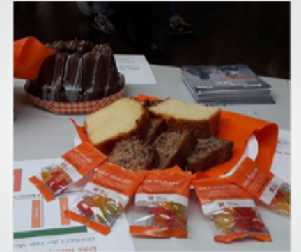
Hochschulmarketing mit süsser Verlockung