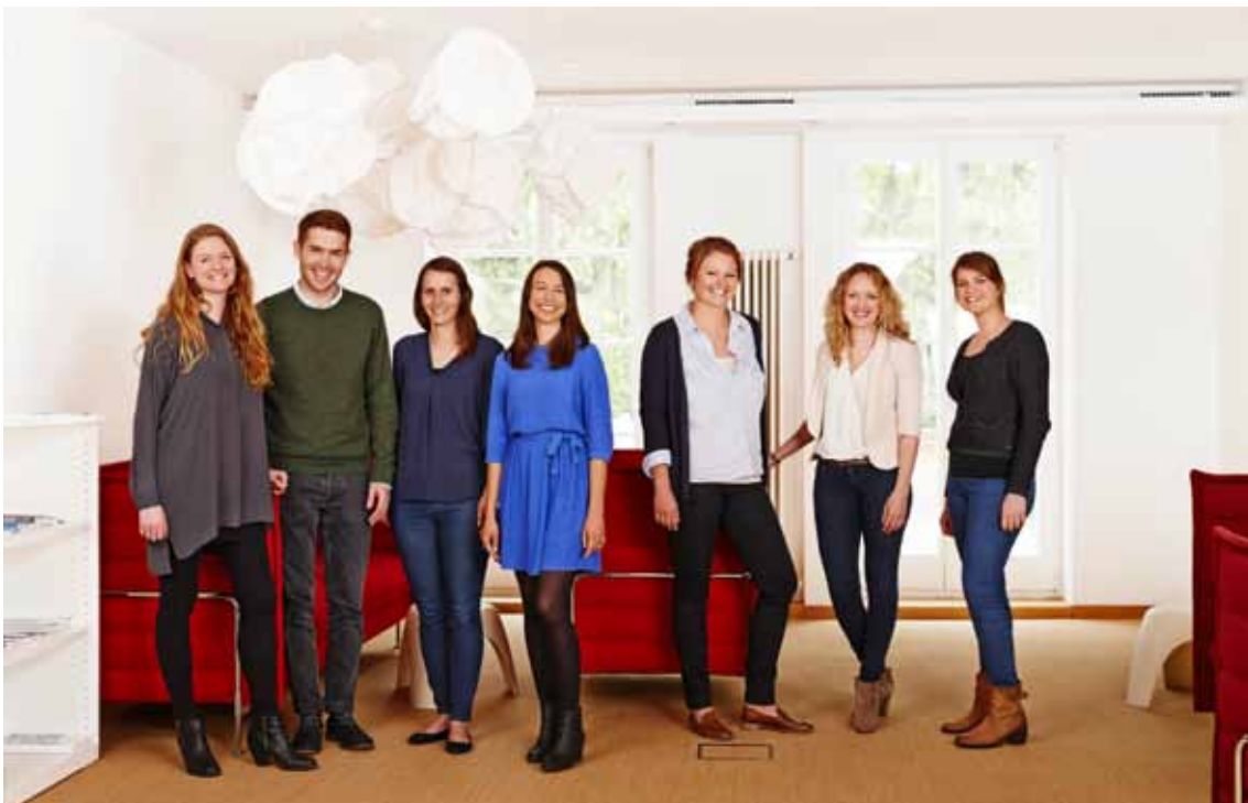
von links nach rechts:

Die Geschäftsführung wird in ihren Aufgaben von einem engagierten Team unterstützt.